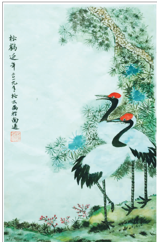
松鹤延年 杨松云/绘

是的,如今的南通港人 你在创业中站起 你从晨曦中走来 日月画出你刚毅的面庞 岁月塑造你人生的风采 你把理想变成了奉献,把激情埋入胸怀 曾记否—— 多少次夜以继日,多少次露宿风餐 多少次头顶三伏酷暑,多少次身披数九 多少次狂风暴雨的洗礼,多少次波涛汹涌的历险