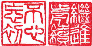
不忘初心 继续前进

虎跃龙腾盛世春。彩韵缤纷,大展经纶,戊戌风雨送佳音。一带欢心,一路欢馨。 己亥兴邦肩愈沉。立马昆仑,壮志凌云,践行使命勉耕耘。百炼成金,梦渐成真。