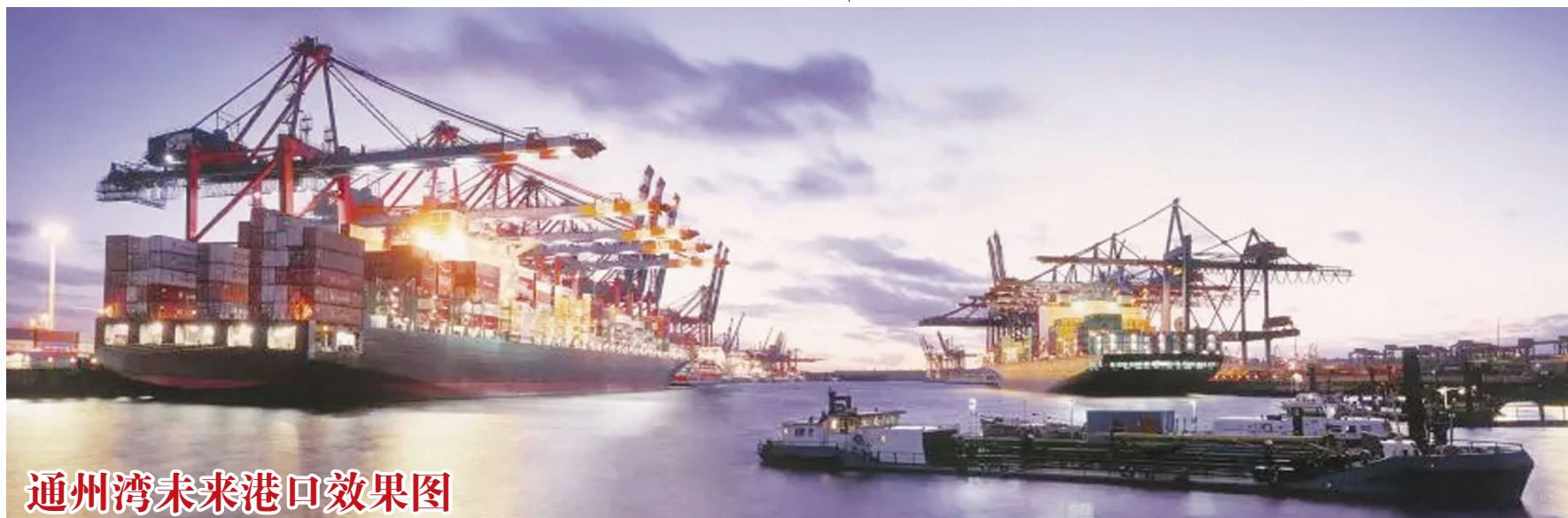
通州湾未来港口效果图

四、增强进取意识,助力通州湾开发。 通州湾建设是南通市以港口转型推动产业转型、城市转型的重要战略,也是江苏省港口重大发展战略部署。李克强总理提出,要把通州湾建设成为长江经济带战略支点,又将通州湾的建设提升为国家和省级战略层面。这是摆在我们南通港人面前的一次重要机遇。现在通海港区至通州湾港区铁路专用线一期工程大型临建被列为2019年江苏省交通建设重点工程项目,工期紧、任务重。省市将重新部署,调整机构设置,增强力量,加大推进力度。但是不管形势任务如何变化,作为南通港口建设大军的一员,我们依然要发扬老一辈南通港人“敢为人先、开拓进取、攻坚克难”的作风,助力建设投资公司,做好通州湾海港建设、疏港铁路专用线工程开发建设,确保圆满完成年度目标任务。